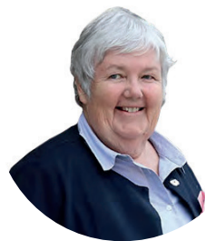
Jacqueline Gourault ministre de la Cohésion des territoires et des Relations avec les collectivités territoriales

Après quarante ans de décentralisation, l'État doit être moins prescripteur et davantage facilitateur pour permettre aux collectivités de mener à bien leurs projets. En ce sens, l'Agence nationale de la cohésion des territoires est d'abord une « fabrique à projets ».