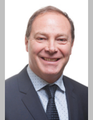
Vincent DELAHAYE Rapporteur Sénateur de l'Essonne (Groupe Union Centriste)

Le présent document et le rapport complet n°709 (2019-2020) sont disponibles sur le site du Sénat : https://www.senat.fr/notice-rapport/2019/r19-709-1-notice.html