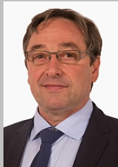
Éric JEANSANNETAS Président Sénateur de la Creuse (Groupe RDSE)