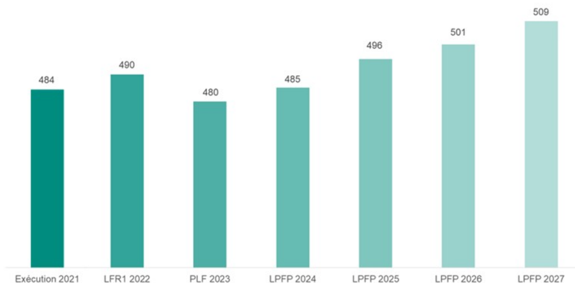
Évolution du périmètre des dépenses de l'État 2021-2027

La définition de ce nouvel agrégat est fournie en annexe du présent exposé général des motifs. L'intégration à ce périmètre, notamment, de missions au caractère temporaire, telle la mission « Plan de relance », ou encore portant des dépenses d'un niveau ou au caractère exceptionnel (telles celles portées par la mission « Investir pour la France de 2030 »), permet une présentation plus exhaustive des dépenses portées par l'État.