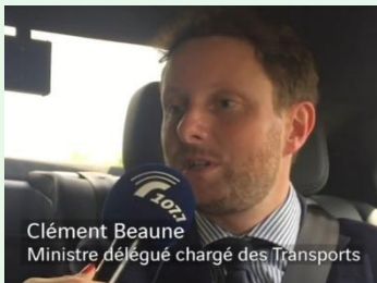
Clément Beaune Ministre délégué chargé des Transports

Les chiffres parlent d'eux-mêmes ! Entre janvier et juillet 2022, le secteur autoroutier déplore 95 accidents* dont 9 corporels*. Deux de nos collègues d'autres sociétés d'autoroutes sont décédés dans l'exercice de leurs missions*. Dix autres ont été blessés*. (*Source ASFA)