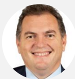
Philippe Tabarot Rapporteur Sénateur des Alpes-Maritimes (Les Républicains)

COMMISSION DE L'AMÉNAGEMENT DU TERRITOIRE ET DU DÉVELOPPEMENT DURABLE