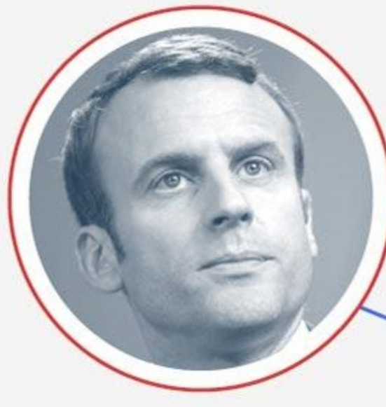
Président de la République EMMANUEL MACRON