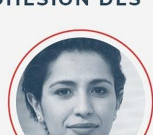
SARAH EL HAÏRY

AUPRÈS DU MINISTRE DE LA TRANSITION ÉCOLOGIQUE ET DE LA COHÉSION DES TERRITOIRES