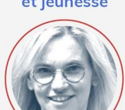
AGNÈS PANNIER- RUNACHER

Transition écologique et cohésion des territoires