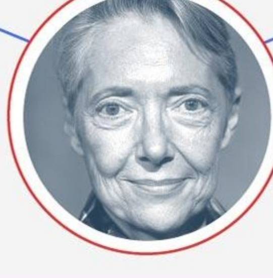
Première ministre ÉLISABETH BORNE

Chargée de la planification écologique et énergétique