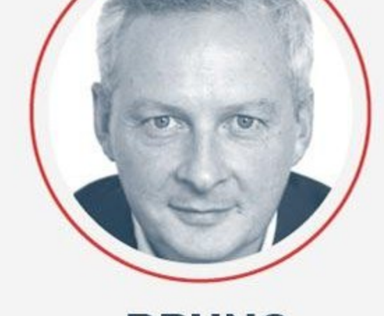
BRUNO LE MAIRE

Économie, finances et souveraineté industrielle et numérique