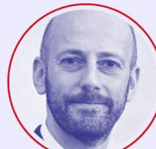
Stanislas GUERINI Transformation et fonctions publiques