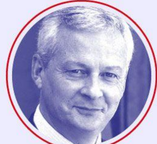
Bruno LE MAIRE Économie, finances et souveraineté industrielle et numérique