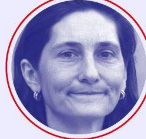
Amélie OUDÉA-CASTÉRA Sports, jeux Olympiques et Paralympiques