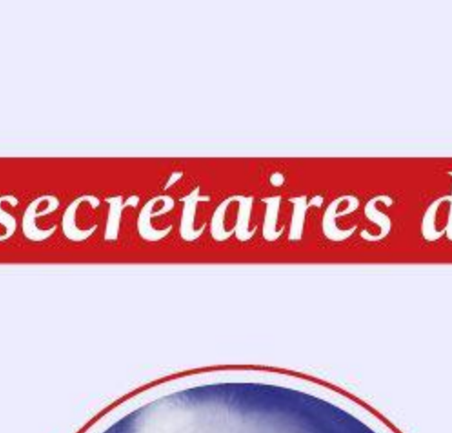
Sabrina AGRESTI- ROUBACHE Ville auprès de Gérald DARMANIN et Christophe BÉCHU Citoyenneté auprès de Gérald DARMANIN