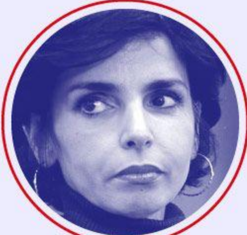
Rachida DATI Culture