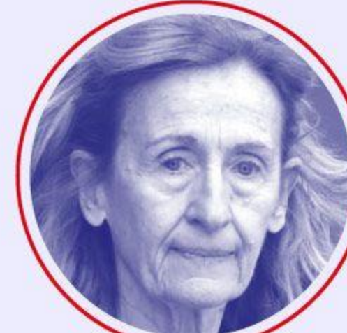
Nicole BÉLOUBET Éducation nationale et jeunesse