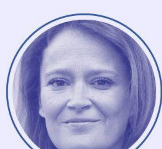
Olivia GRÉGOIRE Entreprises, tourisme et consommation auprès de Bruno LE MAIRE