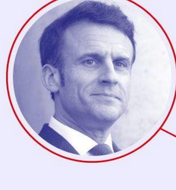
Président de la République Emmanuel MACRON