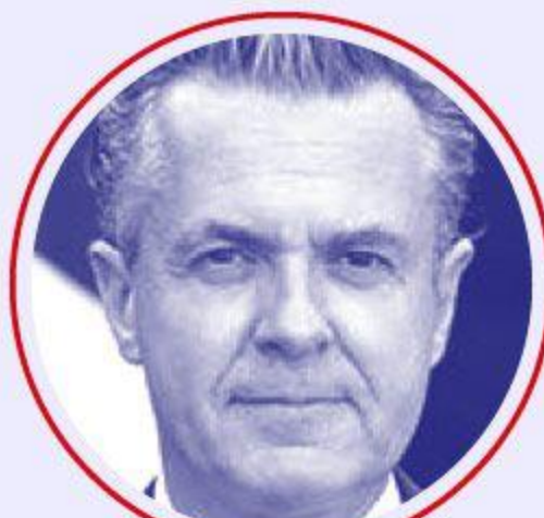
Christophe BÉCHU Transition écologique et cohésion des territoires