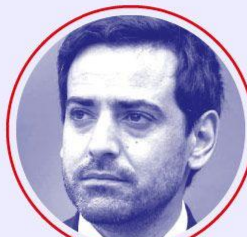
Stéphane SÉJOURNÉ Europe et affaires étrangères