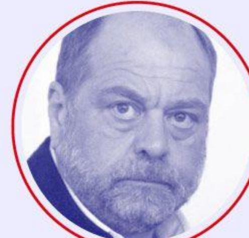
Éric DUPOND- MORETTI Justice