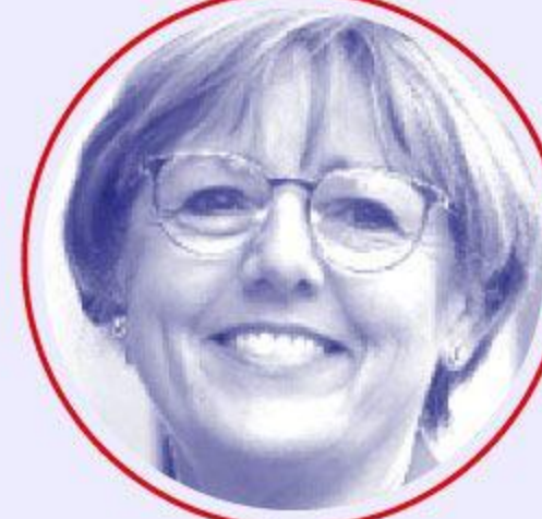
Sylvie RETAILLEAU Enseignement supérieur et recherche