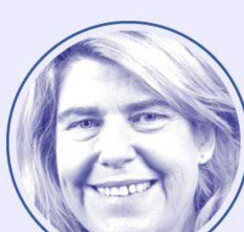
Dominique FAURE Collectivités territoriales et ruralité auprès de Gérald DARMANIN et Christophe BÉCHU