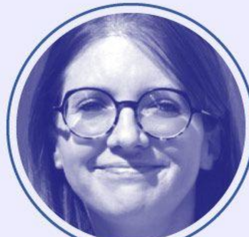
Aurore BERGÉ Égalité entre les femmes et les hommes et lutte contre les discriminations auprès de Gabriel ATTAL