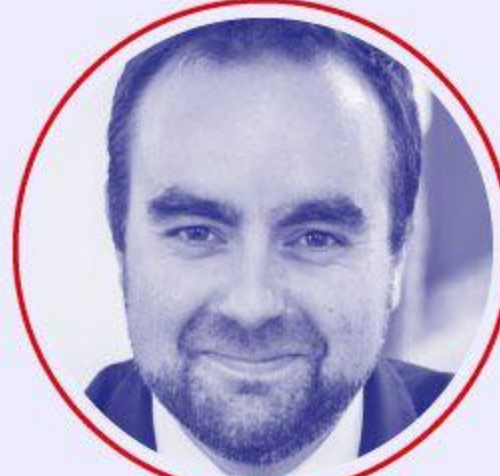
Sébastien LECORNU Armées