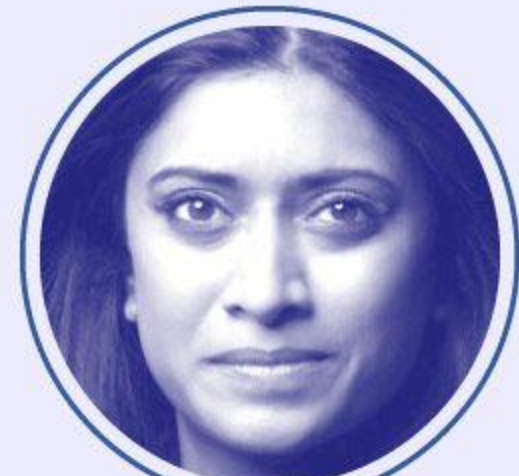
Prisca THEVENOT Renouveau démocratique, porte-parole du gouvernement auprès de Gabriel ATTAL