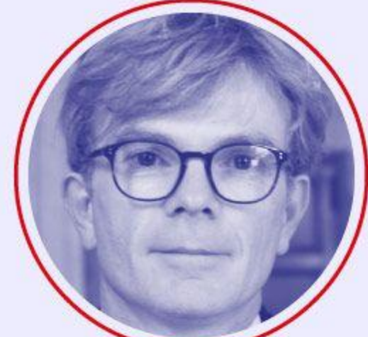
Marc FESNEAU Agriculture et souveraineté alimentaire