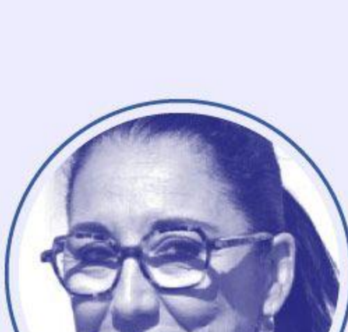
Fadila KHATTABI Personnes âgées et personnes handicapées auprès de Catherine VAUTRIN