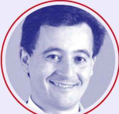
Gérald DARMANIN Intérieur et outre-mer