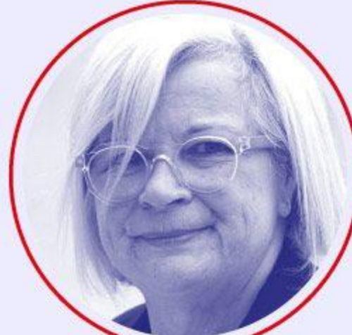
Catherine VAUTRIN Travail, santé et solidarités