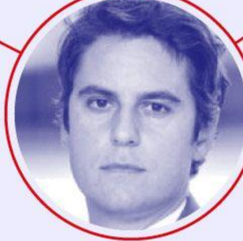
Premier ministre Gabriel ATTAL Chargé de la planification écologique et énergétique