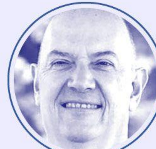
Roland LESCURE Industrie et énergie auprès de Bruno LE MAIRE