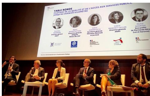
Séminaire des sous-préfets octobre 2023

L'amélioration de la qualité des services publics doit s'incarner au plus près du terrain. Les préfets en sont l'acteur clé, et ils s'appuient pour cette mission sur des sous-préfets chargés des services publics dans chaque département, chargés d'assurer la mise en œuvre de la feuille de route gouvernementale pour la qualité et l'accessibilité du service public.